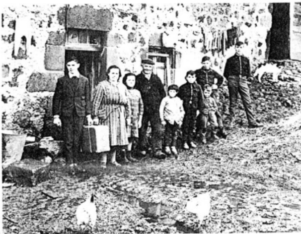
« Dans le passé tous les enfants naissaient contre la volonté des parents »