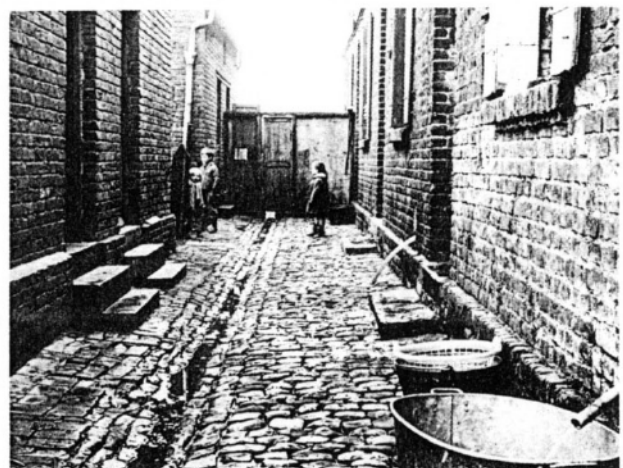
« Ce sont des enfants de milieux défavorisés... »

« Ce n'est pas la FEMME BATTUE qu'il faut aider, mais son MARI. »