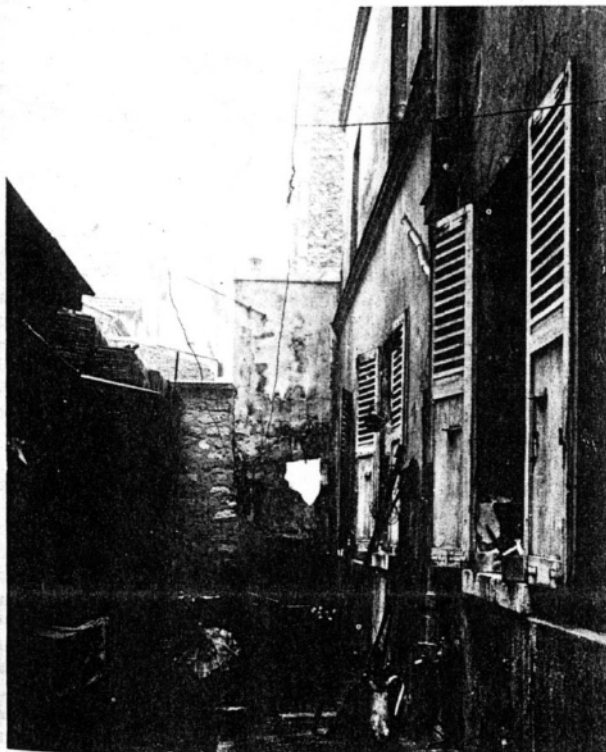
« Il y a le logement mal conçu »

« L'enfant martyr souffre moins que ses parents maltraitants. »